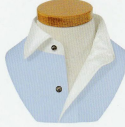
68 ハーフワンピース