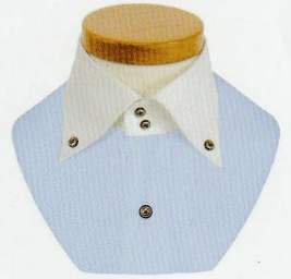
34 ドゥエボットーニ ボタンダウン