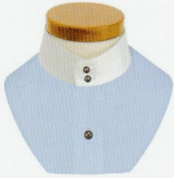
65 ドゥエボットーニ スタンド