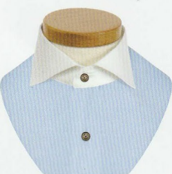
5 カッタウェイ A