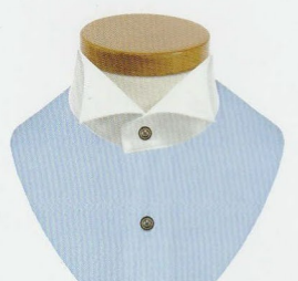
67 ウィング (衿背ループ付)