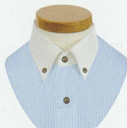
32 ショートボタンダウン