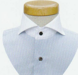
23 カッタウェイ B