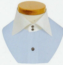
20 HI/ドゥエボットーニ ワイド