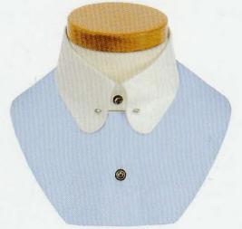
72 ラウンドピンホール