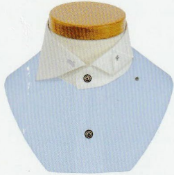
73 カッターウェイ スナップダウン