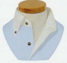
69 ハーフワンピース ボタンダウン